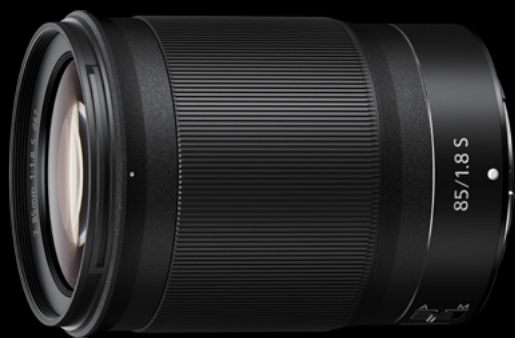
NIKKOR Z 85 mm 1:1,8 S