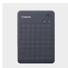
Canon SELPHY QX20