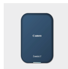
Canon Zoemini 2