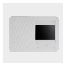
Canon SELPHY CP1500