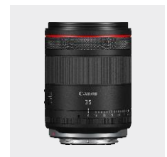
RF 35mm F1.4 L VCM