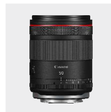
RF 50mm F1.4 L VCM