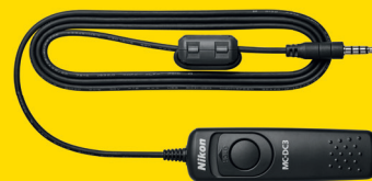
TÉLÉCOMMANDE FILAIRE MC-DC3