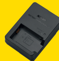
CHARGEUR D'ACCUMULATEUR MH-32