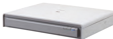
A3 Flatbed Scanner Unit 201

È possibile sottoporre a scansione libri rilegati, riviste e supporti fragili aggiungendo lo scanner Flatbed 101 per documenti fino a formati A4 o lo scanner Flatbed 201 per formati A3. Tramite una semplice connessione USB, questi scanner Flatbed operano senza soluzione di continuità con il DR-M140 in un doppio processo di acquisizione uniforme, consentendo di applicare le stesse funzionalità di ottimizzazione dell'immagine a ogni scansione.