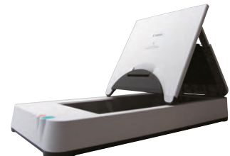
A4 Flatbed Scanner Unit 101