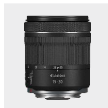
RF 15-30mm F4.5-6.3 IS STM