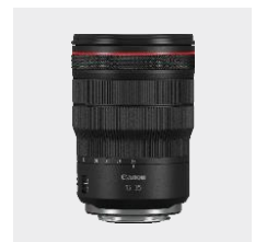
RF 15-35mm F2.8 IS USM