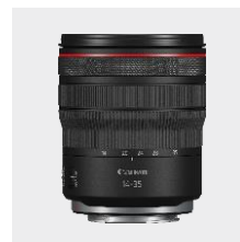
RF 14-35mm F4L IS USM