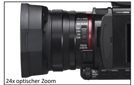
24x optischer Zoom