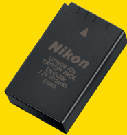
ACCUMULATEUR LI-ION EN-EL20A