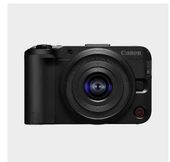
EOS R50 V