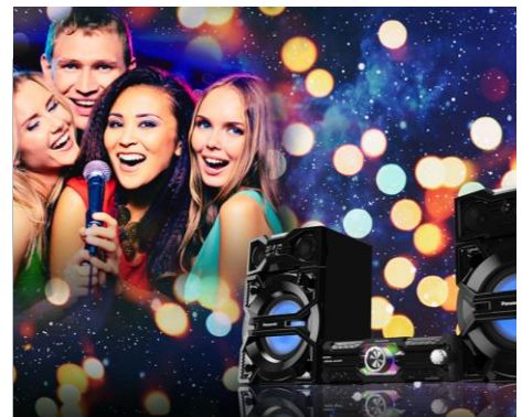
Für den puren Karaoke-Spass

Das SC-MAX3500 bietet Ihnen kraftvollen Sound und ein neues Design, das sich Ihrem Lifestyle anpasst. Ein 25-cm-Super-Tieftöner mit AIRQUAKE BASS sowie ein 10-cm-Tieftöner und 6-cm-Hochtöner ermöglichen besonders dynamische Bässe und einen klaren Sound ganz ohne Verzerrung. Dank ihrer schlanken Bauform fügt sich die Mittelkomponente perfekt in das Design von Fernseher und anderen Ausstattungsgegenständen ein.