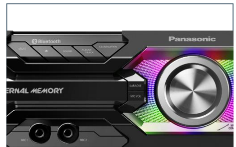
Auffälliges Front-Design mit Leuchteffekte

Das SC-MAX3500 bietet Ihnen kraftvollen Sound und ein neues Design, das sich Ihrem Lifestyle anpasst. Ein 25-cm-Super-Tieftöner mit AIRQUAKE BASS sowie ein 10-cm-Tieftöner und 6-cm-Hochtöner ermöglichen besonders dynamische Bässe und einen klaren Sound ganz ohne Verzerrung. Dank ihrer schlanken Bauform fügt sich die Mittelkomponente perfekt in das Design von Fernseher und anderen Ausstattungsgegenständen ein.